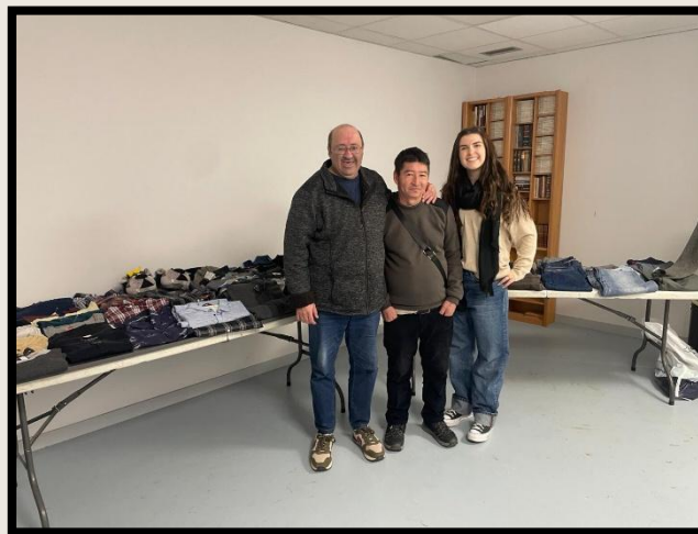
Usuarios de CRPS Arga en uno de sus mercadillos.

Agradecer por ejemplo al CRPS Arga que con sus dos mercadillos nos han aportado más de 1.000€ muy necesarios para cualquiera de las acciones de este año.