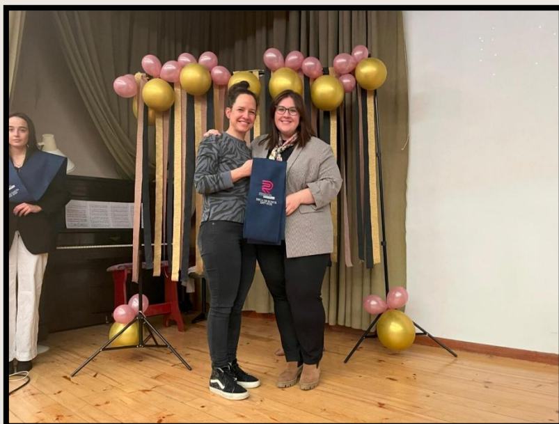
Beca de Honor C.M. Roncesvalles por diez años de charlas

Como todos los años durante 2025 hemos realizado 13 charlas en diferentes lugares de Navarra, centros cívicos, colegios, residencias... dentro de la labor de difusión de los proyectos elaborados. El objetivo principal es el de sensibilizar, dar a conocer otras realidades y provocar una reflexión.