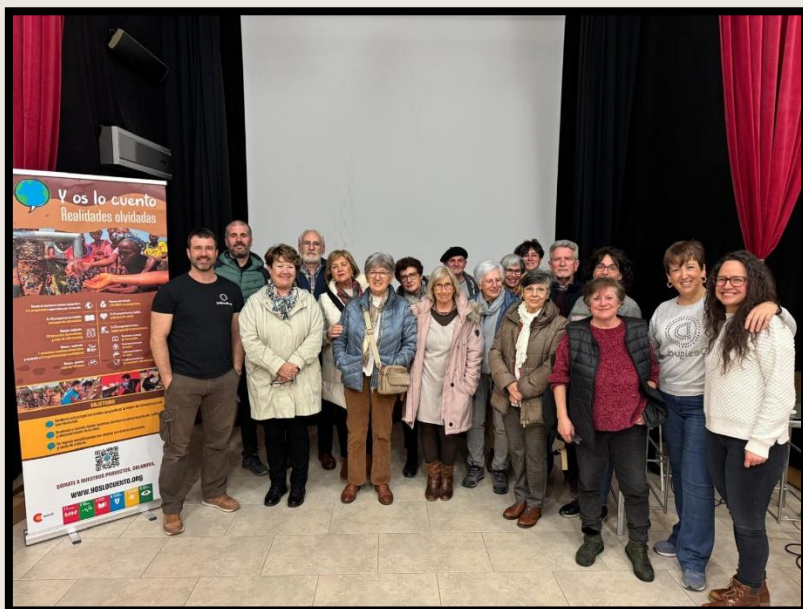
Charla en Beire