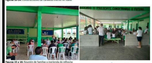
Figuras 15 y 16: Reunión de familias y merienda de niños/as