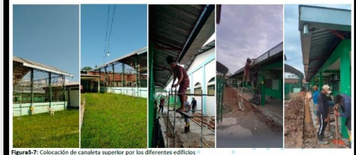
Figuras 3-7: Colocación de canaleta superior por los diferentes edificios