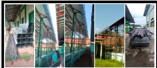
Figuras 1 y 2: Construcción de canaleta superior en cubierta

Aun así, les enviamos los 6000€ comprometidos. El proyecto consiste en la mejora y ampliación del Centro Esperanza de Tapauá (CET) para la óptima realización del “ Programa de promoción integral y defensa de los derechos fundamentales de menores ” entre 9 y 18 años, con el fin de prevenir el abandono escolar, la explotación infantil y laboral y los problemas causados por el alcohol y drogas entre otros.