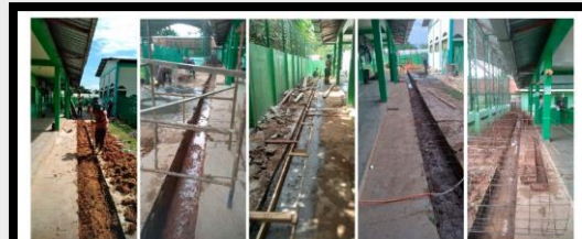
Figuras 10-14: Construcciones de canaleta inferior en suelo